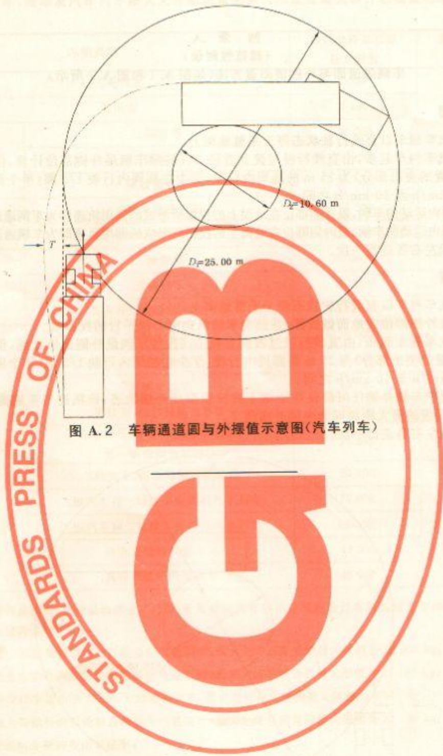
图 A.2 车辆通道圆与外摆值示意图(汽车列车)